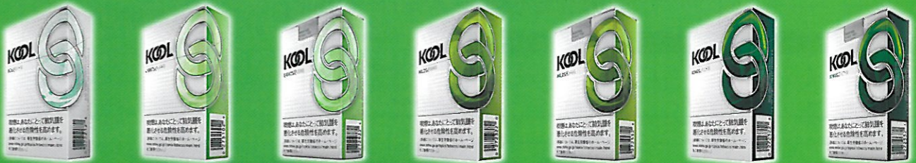
クール・エース・ボックス クール・ライト・ボックス クール・ライト・FK クール・マイルド・FKボックス クール・マイルド・FK クール・FKボックス クール